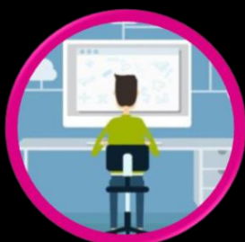
دوره‌های آموزشی تخصصی مرکز