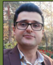
کوهیار شمسی منطقه ۲