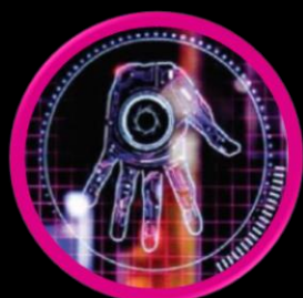
گزارش جلسات ویدئوکنفرانس