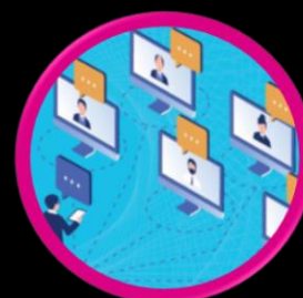
گزارش وبینارها تخصصی مرکز