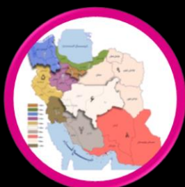
نماینده‌های هوشمندسازی مناطق دهگانه کشور